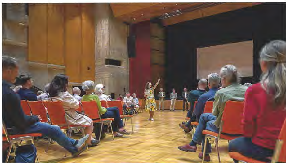
Teilnehmende am Konvent DialogRaumGeld, Mai 2022

Etwa 160 Menschen kamen zwischen dem 22. und dem 24. Mai zum neuartigen Konvent DialogRaumGeld in den Kongress am Park in Augsburg. In Workshops ging es darum, wie wir mit einem neuen Umgang mit Geld unser wirtschaftliches und persönliches Wohl verbessern können. Mehr Liebe in Unternehmen und wertvolle Geldinvestitionen mit Sinn sind dabei der Schlüssel für ein alternatives Wirtschaften im postfossilen Zeitalter.