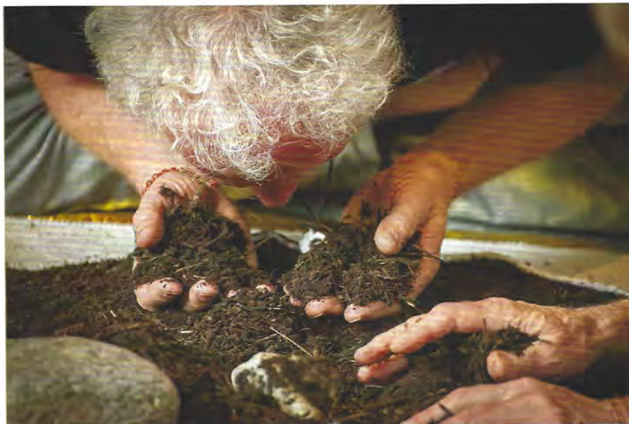
Workshop wERDschätzung beim Konvent

Der Konvent diente als Auftakt für einen mehrjährigen Prozess, bei dem einzelne Projekte in regionalen oder thematischen Gruppen weiterbearbeitet werden. Erste Netzwerke nehmen bereits ihre Kommunikationsstruktur und ihre Arbeit auf. Jährlich sollen die Ergebnisse beim Konvent in Augsburg zusammengetragen werden und gleichzeitig neue Impulse in den Prozess gebracht werden.