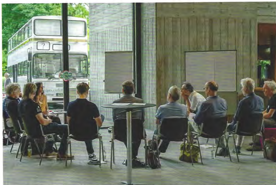
Dialogrunde beim Konvent DialogRaumGeld, Mai 2022, Fotos von Leo Schenk, TOVISIO.net

des Geldes nach, befassten sich in Rollenspielen mit dem gesellschaftlichen Umgang mit Geld, deckten persönliche Glaubenssätze zu Geld auf oder boten einfach nur einen Austausch eigener Erfahrungen zum Thema Geld an.